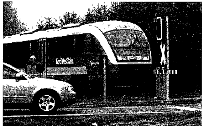
Sinds 2005 rijdt de Haller Willem met veel succes tussen Osnabrück en Dissen/Bad Rothenfelde.